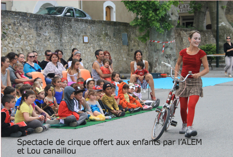
Spectacle de cirque offert aux enfants par l'ALEM et Lou canaillou