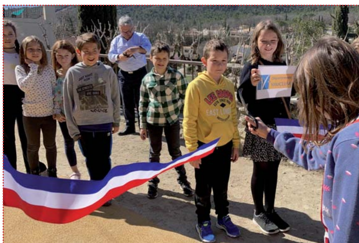
Inauguration de l'aire de jeux rue Magdeleine par les petits élus du CME

Enfin pour dire aurevoir à l'ancienne école les enfants ont souhaité organiser une fête au mois de juin et pourquoi pas laisser une trace de cette vie scolaire en faisant des dessins ou écrire des messages sur le mur de foot !!