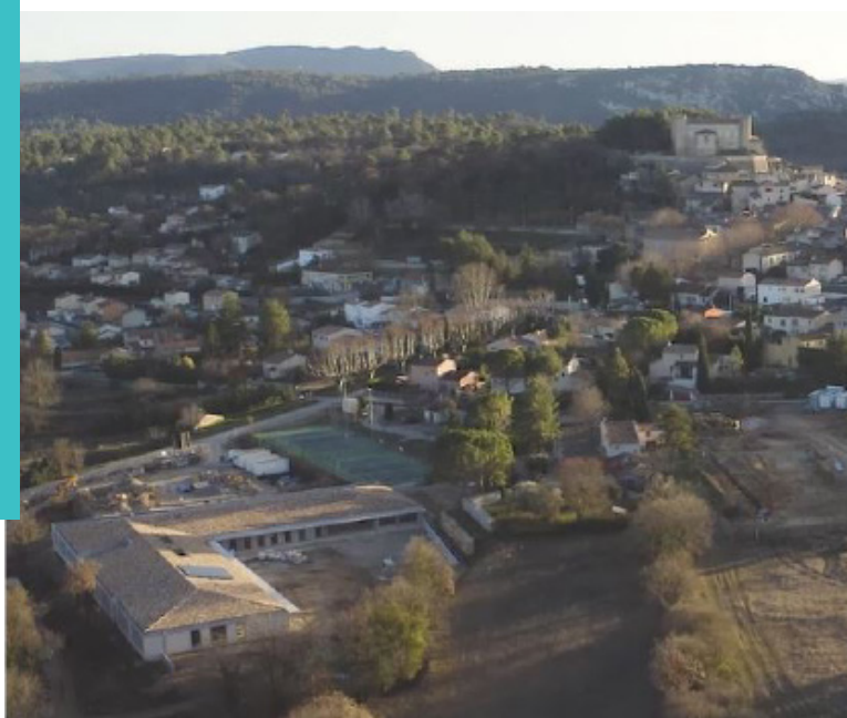
Sobriété des lignes architecturales du groupe scolaire pour mieux s'intégrer dans notre environnement