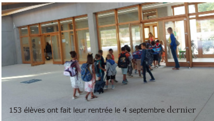
153 élèves ont fait leur rentrée le 4 septembre dernier

Augmentation du ticket de cantine + 20 centimes d'€ La majorité municipale ne l'avait pas augmenté depuis 2019