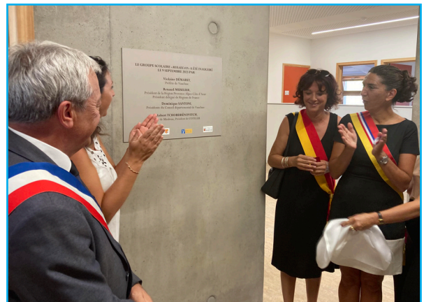
Dévoilement de la plaque inaugurale

L'inauguration s'est poursuivie avec le dévoilement de la plaque inaugurale installée dans le hall d'entrée de l'école.