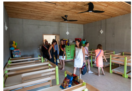
Découverte de la salle du dortoir